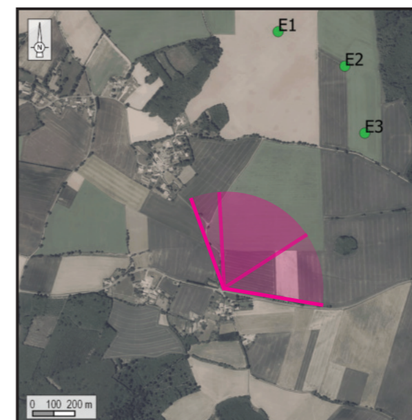
Orthophotographie 1 / 25 000