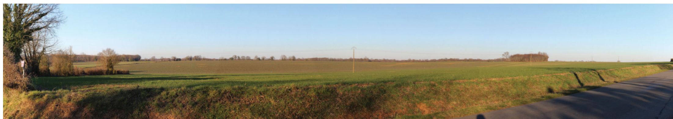
Vue panoramique de l'état initial (angle de vue 120°)